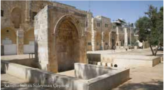
Kanuni Sultan Süleyman Çeşmesi